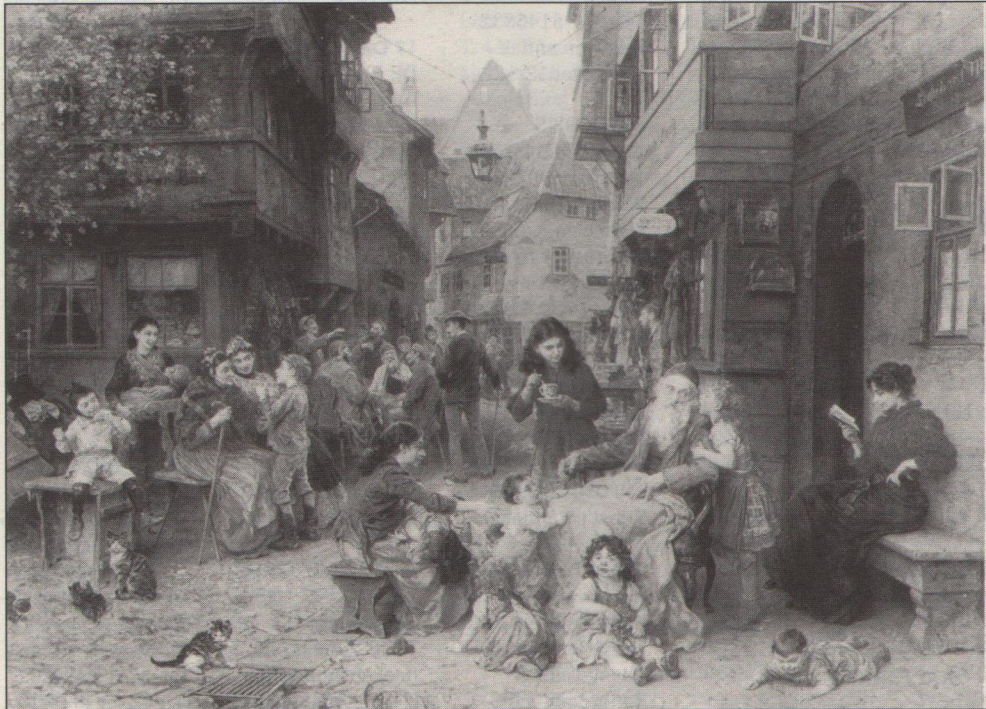
lot 548: L. Knaus 'In dem Shtetl'. 1894, 108 x 147cm.

Over emotionele waarde gesproken, was de Mauerbach-veiling, die eind oktober in Wenen werd gehouden, één van de meest aangrijpende veilingen ooit. Christie's Londen veilde daar in het Museum für angewandte Kunst, een 'oorlogsnalantkunst', schilderijen en kunstvoorwerpen die door de nazi's bij Joodse burgers in beslag waren genomen. Bijna alle kunstwerken die werden geveild, waren nooit opgeëist door de eigenaren of hun erfgenamen en