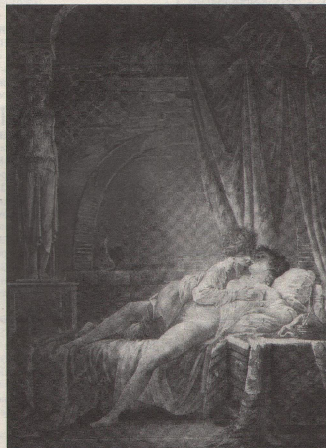
(lot 376) F. Stahl, Liebespaar, paneel, 32 cm.

1 mln. ATS, prikkelde ook mij te bieden op deze, voor die tijd heel moderne, kruising tussen beeld en schilderij: Sculptomalerei. Maar de biedrally schoot tussen twee telefoonbidders al heel snel door naar 4.2 mln ATS (8 ton). Een subliem bloemstilven van A. Mignon (1640-1679) was het kostbaarste stuk van de veiling. Met een opbrengst van 2,1 miljoen gulden werd het toegewezen aan Richard Green uit Londen, een briljante kunstkenner van Joodse afkomst en 's werelds sterkst biedende kunsthandelaar.