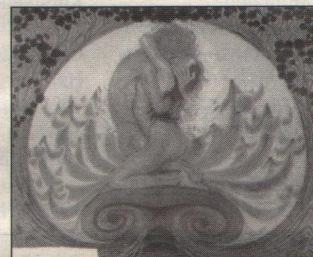
(lot 381) 'Fidus' H. Hëppener, 'Erfüllung' 1912

veilingen gehouden waarbij de complete inboedel van een kasteel of villa wordt geveild als 'The Property of a Nobleman'. De prijzen die dan worden gerealiseerd zijn vaak aanmerkelijk hoger dan die welke in normale veilingen zouden worden behaald. De oorzaak hiervan moet men, denk ik, zoeken in de grotere zekerheid die de koper heeft omtrent de authenticiteit van het kunstvoorwerp en ook in de elitaire voorkeur en keuze van de adellijke familie die als het ware ermee verkocht wordt. Als het een kasteelveiling van allure betreft, kan daarbij sterker nog dan normaal het geval is, het fenomeen 'emotionele waarde' om de hoek komen kijken. De af-